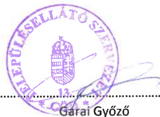
Garaí Győző igazgató